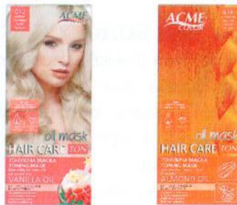
ТонуЮча маска для волосся ACME-COLOR "Hair Care TON oil mask"

Тонувати волосся маскою Hair Care Ton Oil Mask — швидко і безпечно.